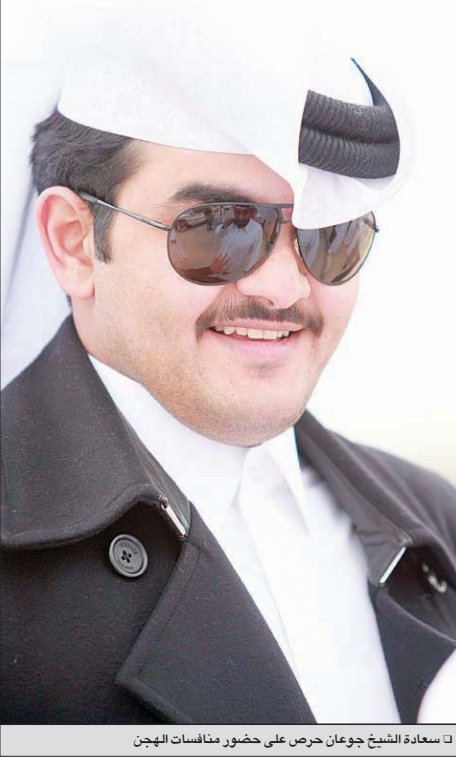
السعادة الشيخ جوعان حرص على حضور منافسات الهجن